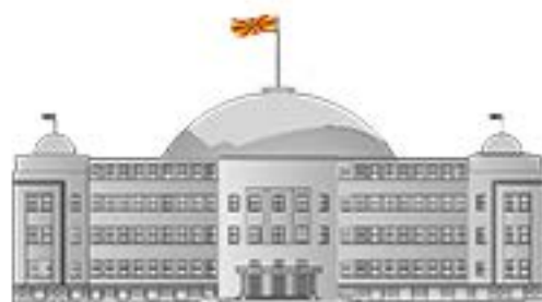
KUVENDI I REPUBLIKËS SË MAQEDONISË SË VERIUT